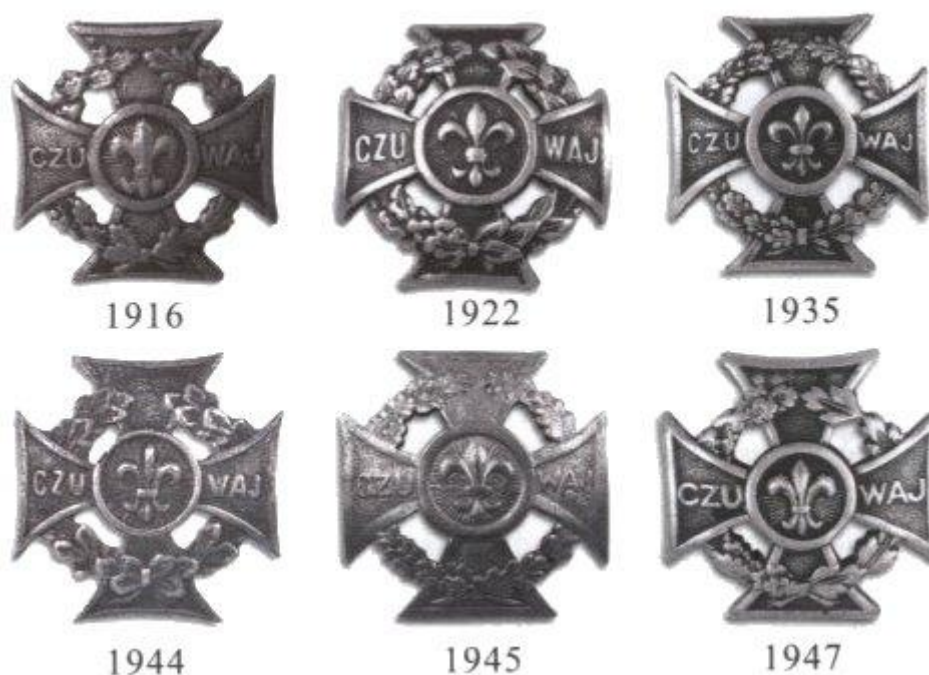
Rys. historia krzyża

jednak zawsze symboliczne elementy wskazane przez ks. Lutosławskiego. Dawniej powszechnie było wybijanie na odwrocie krzyża kolejnych, indywidualnych numerów odznaki, do dziś taki zwyczaj przetrwał jeszcze w niektórych środowiskach harcerskich. Krzyż harcerski wykonany jest z oksydowanego metalu. Otrzymuje go każda harcerka oraz każdy harcerz po złożeniu Przyrzeczenia Harcerskiego, raz na całe życie. Nosi się go 2 cm nad środkiem lewej kieszeni munduru.